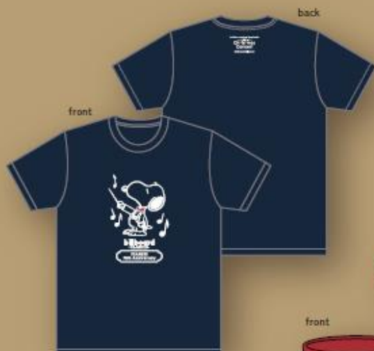
Tシャツ NAVY S / M / L ¥3,800(税込)