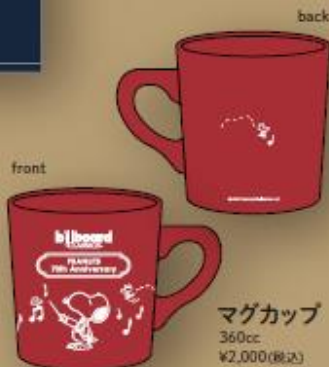
マグカップ 360cc ¥2,000(税込)