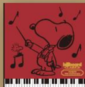
ハンドタオル 25cm角 ¥1,200(税込)