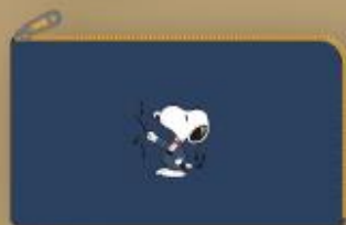
ポケット マルチポーチ W215×H120mm ¥1,800(税込)